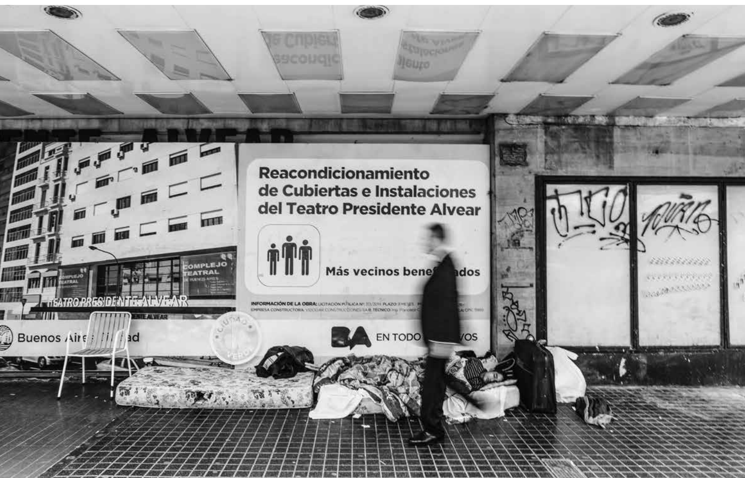
El Alvear, en plena calle Corrientes, abandonado desde hace tres años.

Se volvió a postergar la apertura del San Martín y del Alvear no hay ni anuncios. Cómo afecta esta política del vacío a espectadores y artistas. Datos y preguntas. ▶ LUCÍA AITA