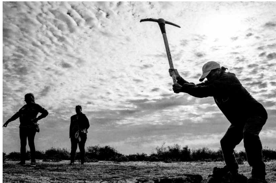
Imágenes de las Brigadas de familiares buscando desaparecidos. Para que no los maten anuncian: "Buscamos víctimas, no culpables".