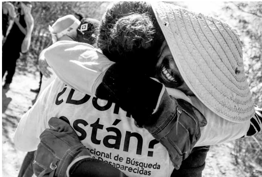
Entrar en Sinaloa con las Brigadas es inédito y habla de su poder social.

La dificultad mayor es que todos en la familia están sospechados de estar vincu-