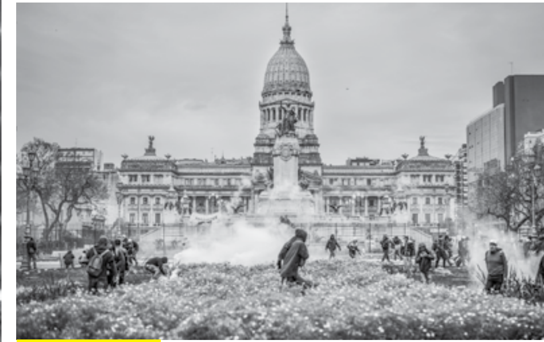
El gritazo trava y trans ya es una cita en Plaza de Mayo. El Encuentro Nacional de Mujeres, esta vez en Trelew, también. La foto de la represión que garantizó la votación del Presupuesto 2019. Y abajo, de nuevo, estudiantes y docentes unidos contra el recorte presupuestario en educación.