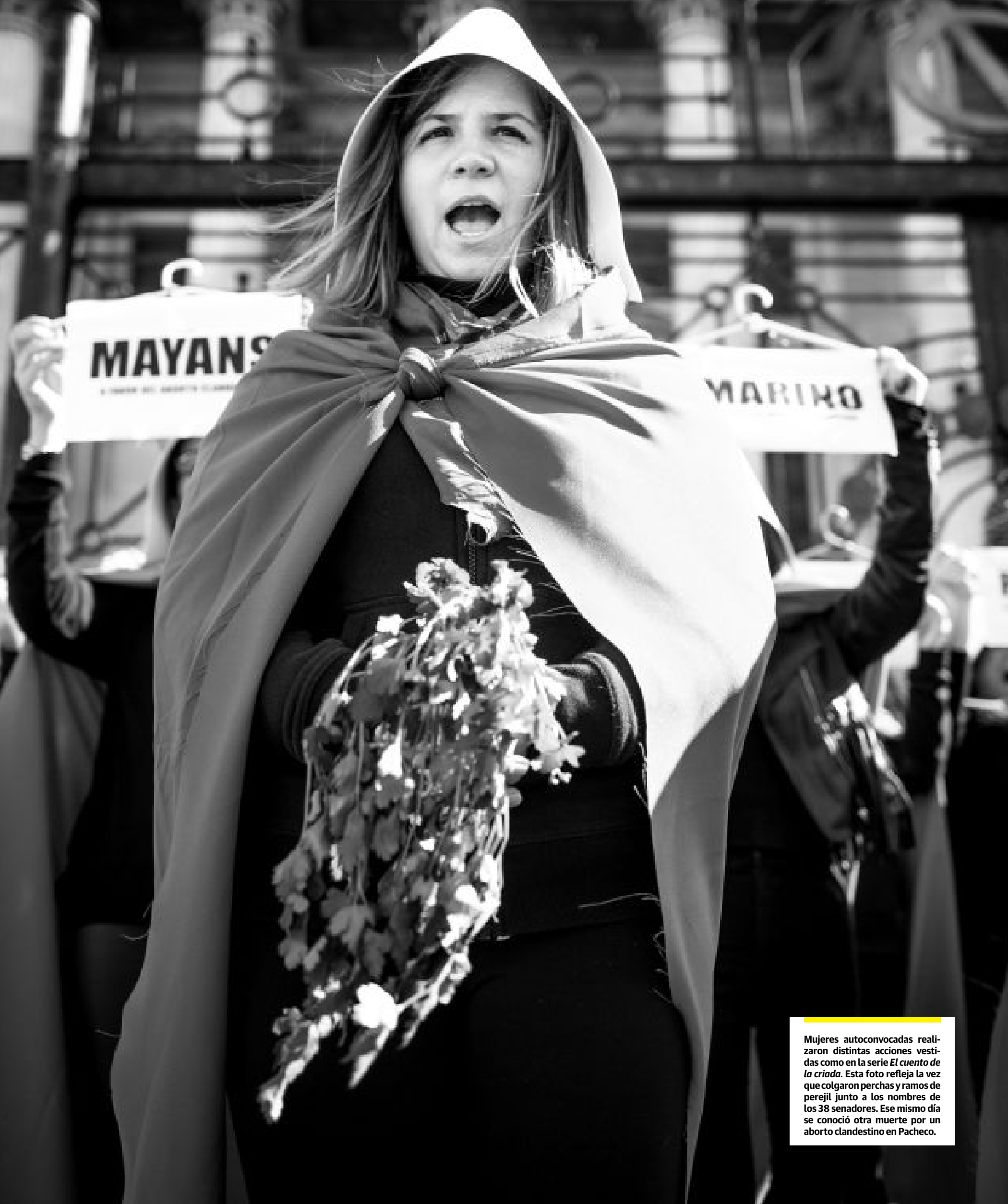
Mujeres autoconvocadas realizaron distintas acciones vestidas como en la serie El cuento de la criada . Esta foto refleja la vez que colgaron perchas y ramos de perejil junto a los nombres de los 38 senadores. Ese mismo día se conoció otra muerte por un aborto clandestino en Pacheco.